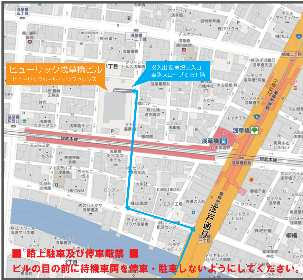
[ 搬入出推奨ルート ]